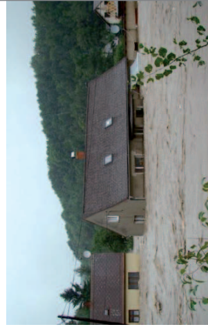
Fotografie z obce v době povodní